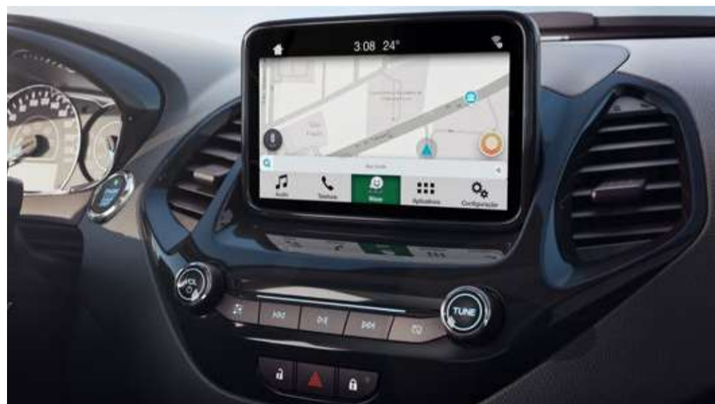
Sync®3 com tela de 6,5" e Waze na tela do carro para usuários de Android e Apple iOS