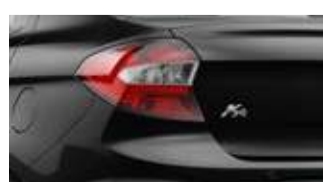
Preto Bristol (perolizada)