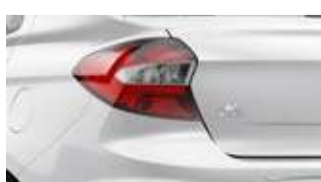
Branco Ártico (sólida)