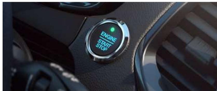
Ford Power – Partida sem chave