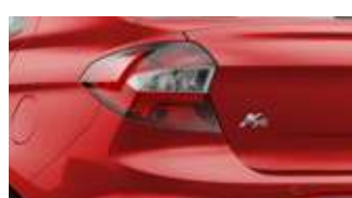
Vermelho Arpoador (sólida)