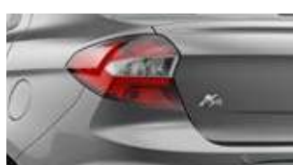
Prata Dublin (metálica)