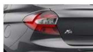
Cinza Moscou (perolizada)