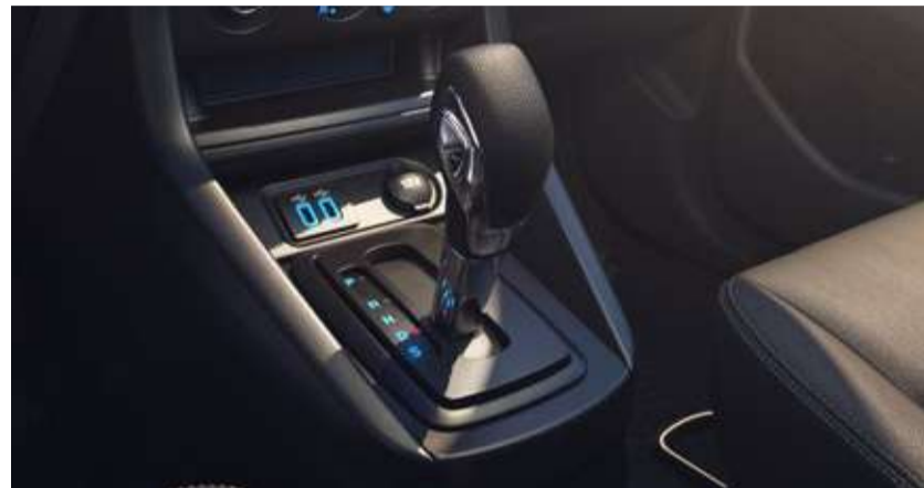
Nova Transmissão Automática