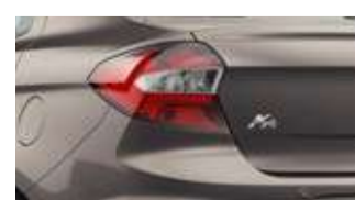
Cinza Copenhague (perolizada)